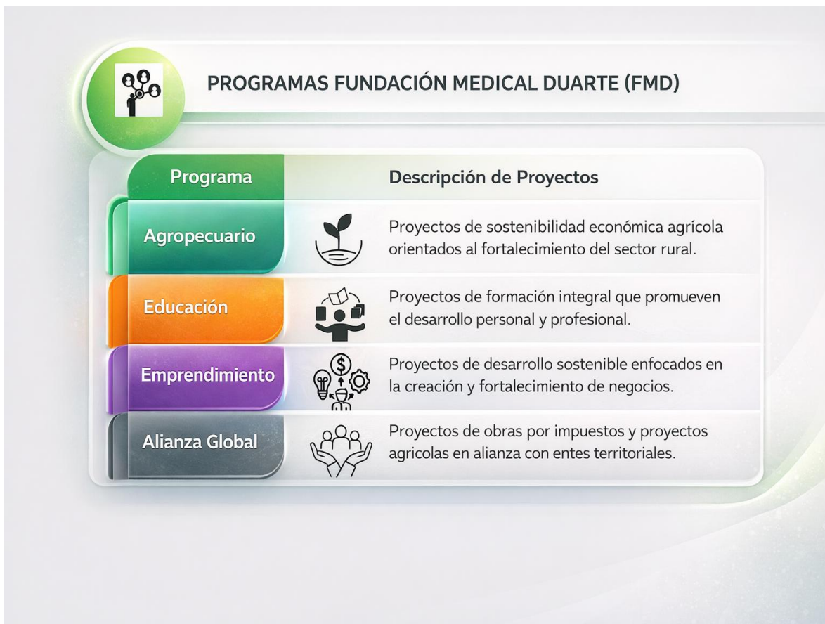
Figura 1. Programas Fundación Medical Duarte (FMD)

En este marco, los proyectos se agrupan en los siguientes programas: