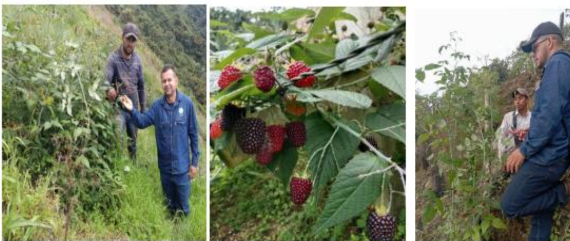
Productores en unidades productivas de mora Sedes Cucutilla y Lourdes