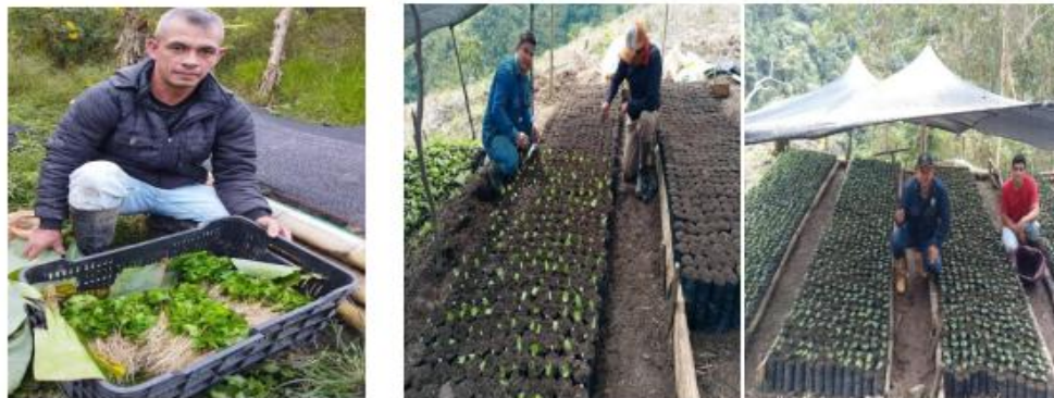
Productores recibiendo chapolas de café - Municipios de Cucutilla y Gramalote