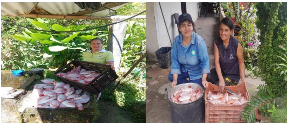
Figura 11. Proyecto de tilapia