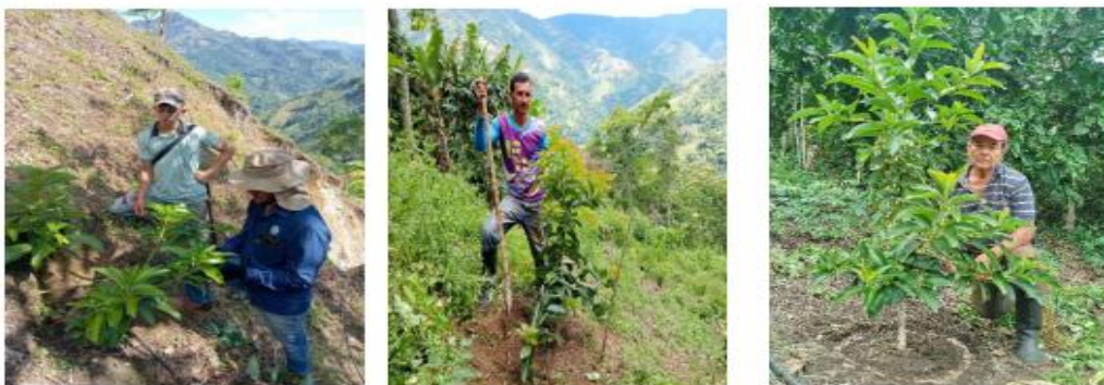
Productores beneficiarios en unidades productivas de aguacate lorena