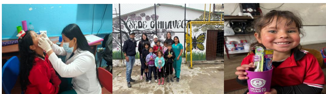
Figura 16. Higiene bucal 2025

Asimismo, se desarrollaron procesos de educación mediante charlas didácticas en cada una de las sedes de estas provincias, promoviendo hábitos adecuados de higiene bucal.