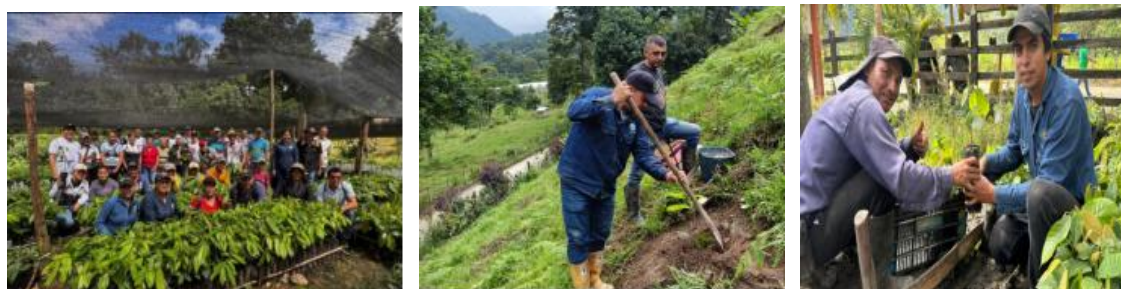
Figura 3. Proyecto de cacao

4.1.2 Proyecto de caña panelera. La caña panelera es altamente relevante para las familias rurales porque fortalece su economía al generar ingresos estables a partir de un cultivo tradicional y de alta demanda, como la panela, que además tiene un valor cultural y alimenticio importante. Esta iniciativa beneficia a 34 familias con la entrega de insumos, análisis de suelos, plan de fertilización y de manejo sanitario. Se realiza acompañamiento por parte del profesional o técnico para garantizar el desarrollo adecuado de los cultivos.