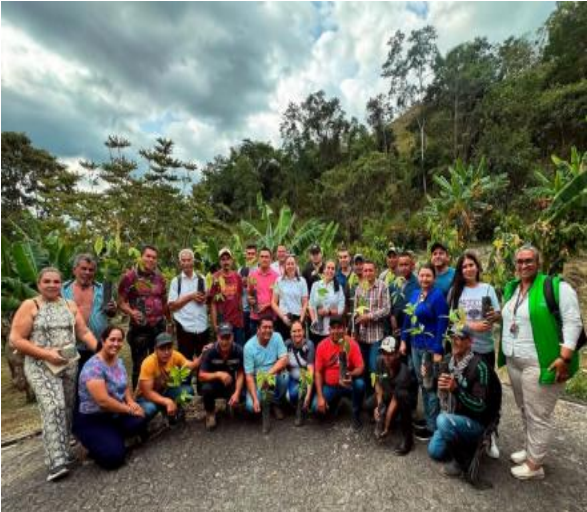
Figura 13. Familias beneficiarias proyectos huertas y cultivos de lulo municipio de Durania