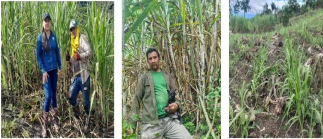
Unidad de caña -Cucutilla