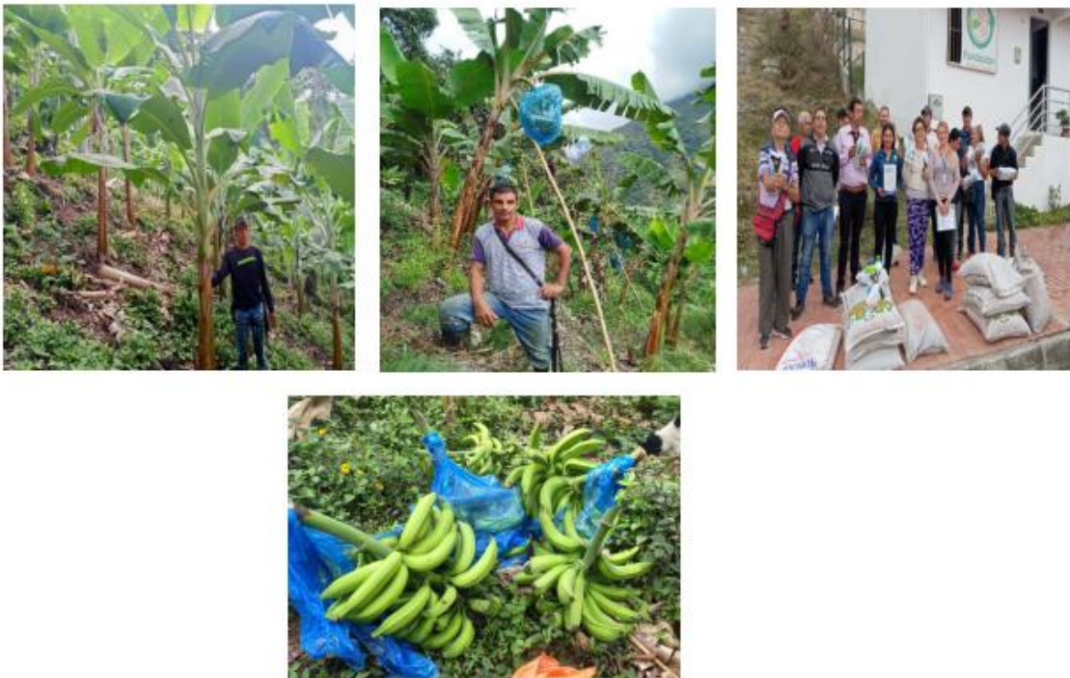
Figura 8. Proyecto de plátano

4.1.7 Proyecto de lulo larga vida. El cultivo de lulo representa una oportunidad clave para el desarrollo económico y social de las familias rurales del municipio de Cucutilla. Este fruto, altamente valorado por su sabor y demanda en el mercado, permite a las familias generar ingresos estables sin necesidad de grandes extensiones de tierra. Además, su producción fomenta la diversificación agrícola, reduce la dependencia de cultivos tradicionales y fortalece la seguridad alimentaria. Se entregó a cada familia plantas de lulo variedad larga vida, análisis de suelos, insumos, fertilizantes y asesoramiento.