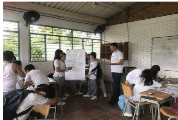
IE EL RODEO

Resultados. Programa: Fortaleciendo Vidas Habilidades para la Vida y Prevención del Consumo.