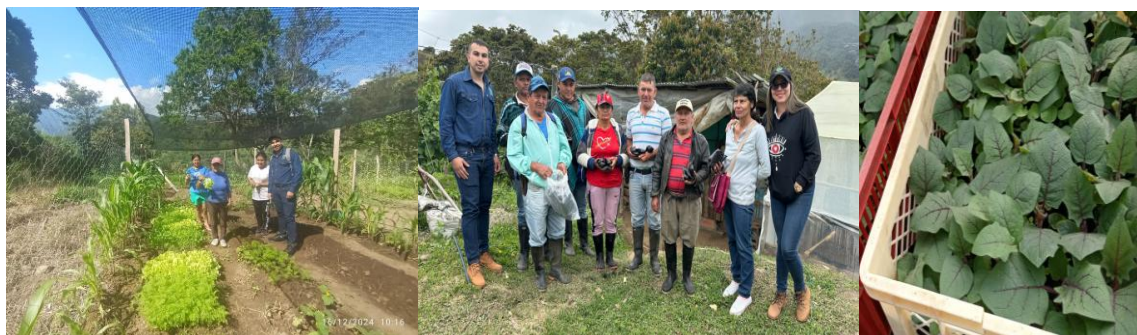
Cuadro 13. Durania