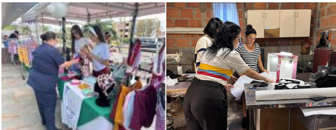
Figura 19. Paso a paso hacia la prosperidad empresarial en calzado y confección