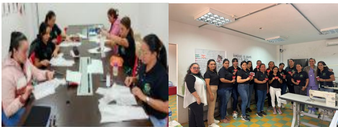
Figura 18. Empoderamiento femenino