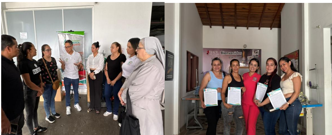
Figura 20. Equipando microempresarios para el éxito