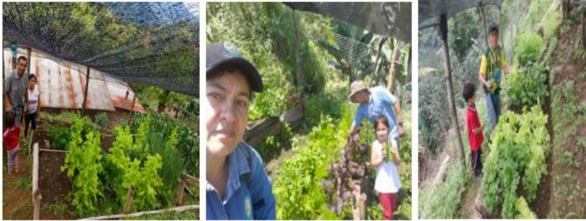
Familias con huertas caseras - Municipios de Cucutilla y Salazar

4.1.10 Proyecto de tilapia. El cultivo de tilapia representa una oportunidad clave para el desarrollo de las familias rurales, ya que combina seguridad alimentaria con generación de ingresos. Esta actividad permite producir una fuente de proteína de alta calidad de manera relativamente económica y sostenible, incluso en espacios pequeños, lo que la hace accesible para comunidades con recursos limitados. Además, la tilapicultura puede integrarse fácilmente con otras actividades agrícolas, diversificando la economía familiar y reduciendo riesgos ante pérdidas en otros cultivos. Este proyecto beneficia a 20 familias rurales con la entrega de alevinos, alimento concentrado y apoyo en adecuación de los estanques con el asesoramiento profesional y técnico en cada fase.