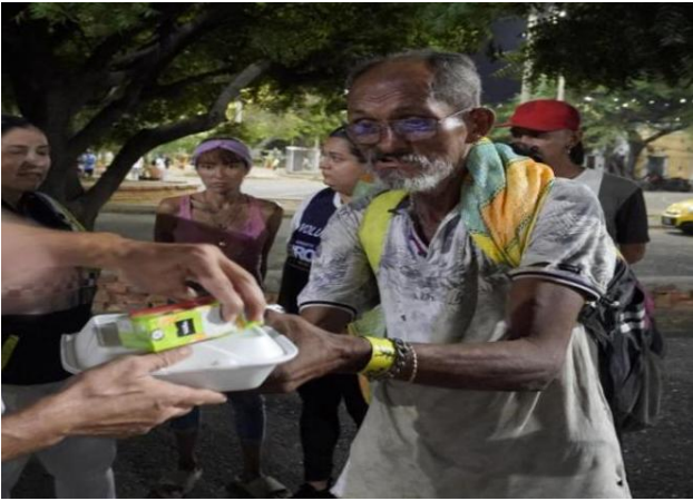
Figura 23. Calor humano: alimentando cuerpos, curando heridas