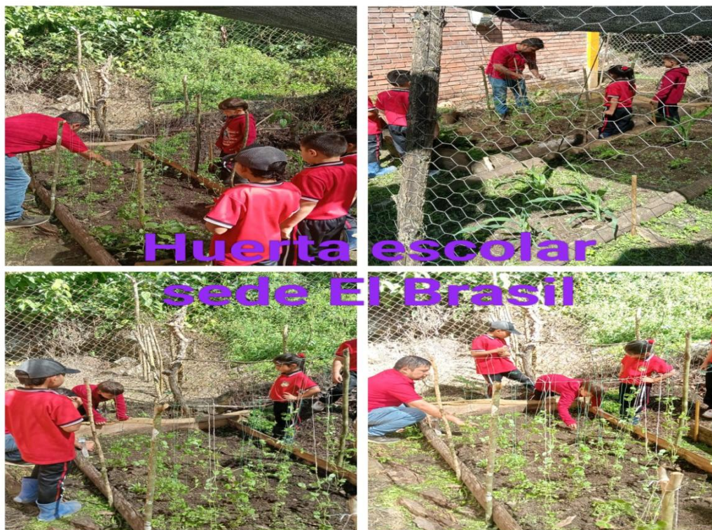
Figura 15. CER La Colonia sede El Brasil Bochalema, Norte de Santander