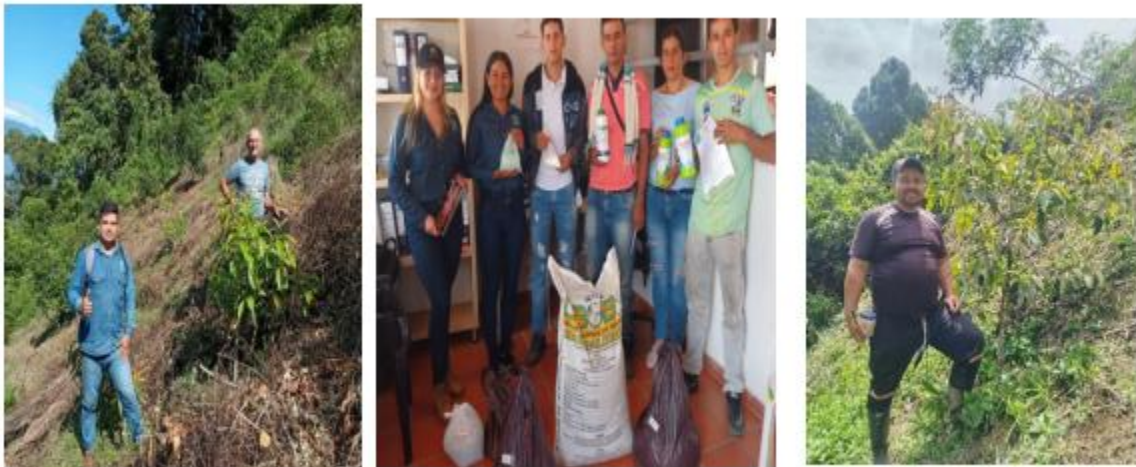
Cultivo aguacate cucutilla entrega de insumos a familias Productor en cultivo Arboledas